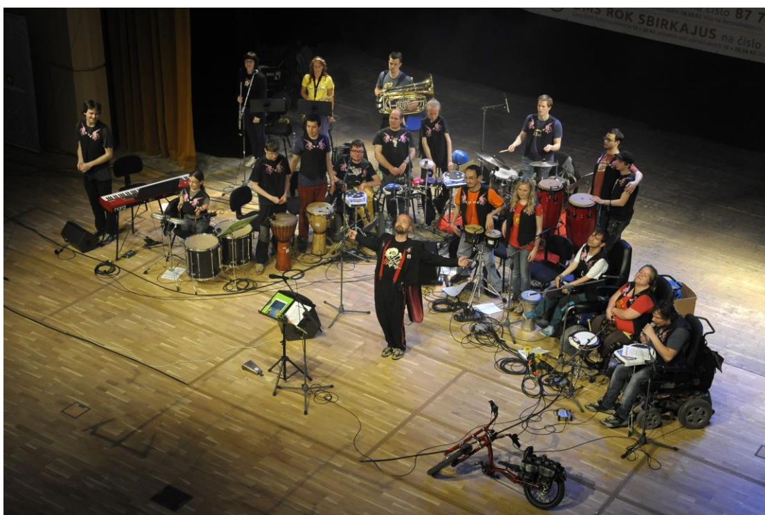
The Tap Tap