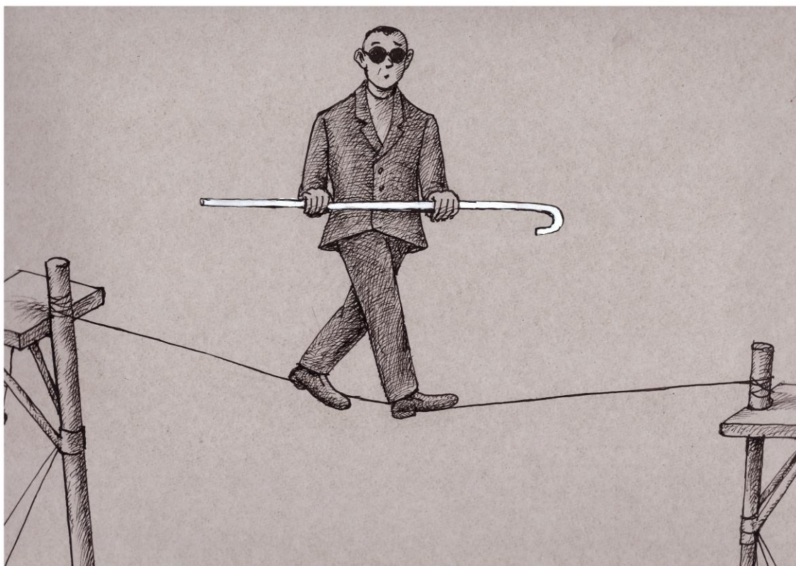
Kreslený vtip, který byl vydražen za krásných 25.000 Kč