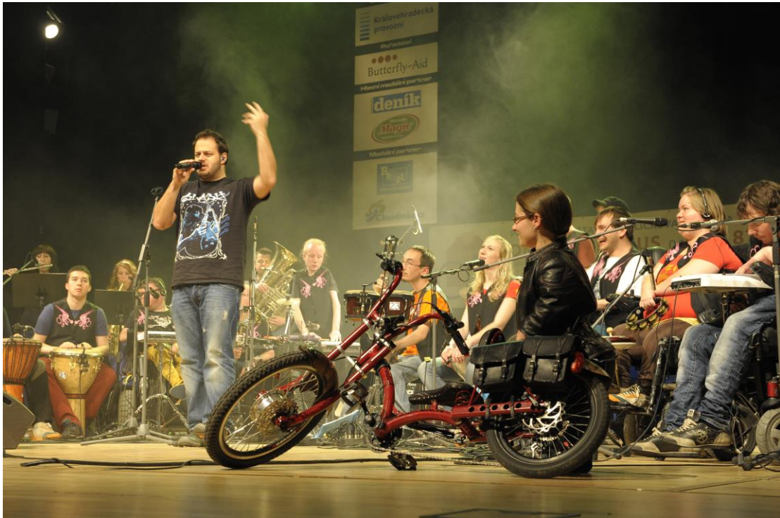
The Tap Tap a Xindl X